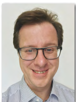
Kassian Gunsch Versand

Telefon +49/86 33/509 64-21 E-Mail teising@haba-beton.de