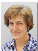
Theresia Meindl Frachtgutschrift

Telefon +49/86 33/509 64-28 E-Mail frachtgutschrift@haba-beton.de