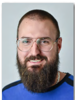
Alexander Gegic Technik (Schächte)

Telefon +49/86 33/509 64-12 E-Mail teising@haba-beton.de